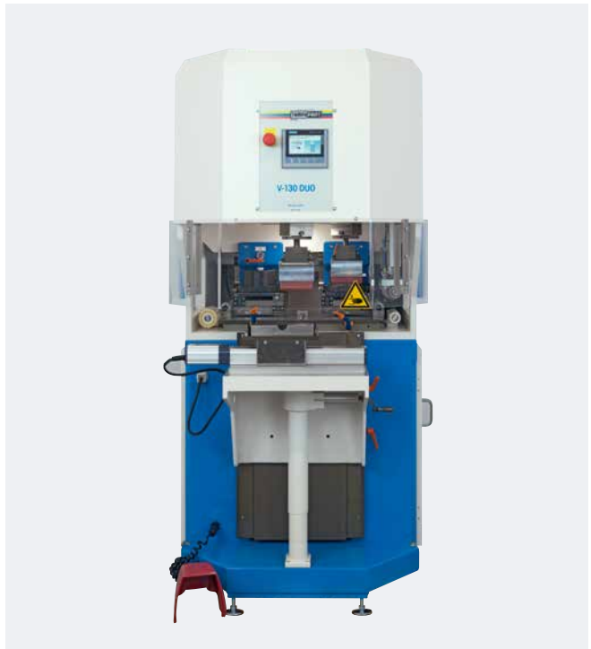
V-DUO 130/130 Steckerleiste