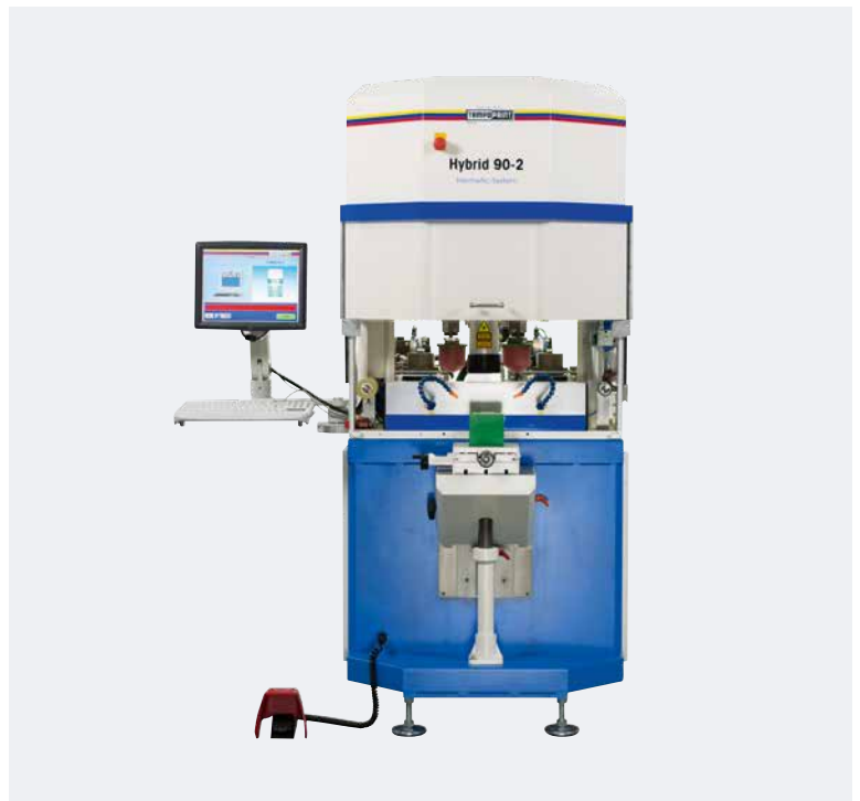
HYBRID 90-2 2-Farben-Tampondruckmaschine mit integrierter Klischeefertigung