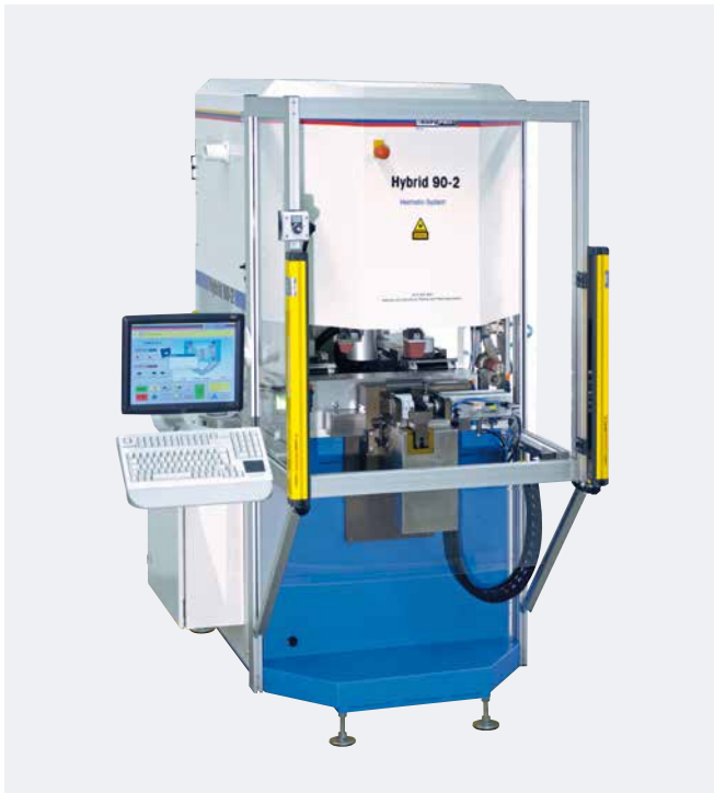
HYBRID 90-2 mit Option Lichtvorhang Schalterschütz