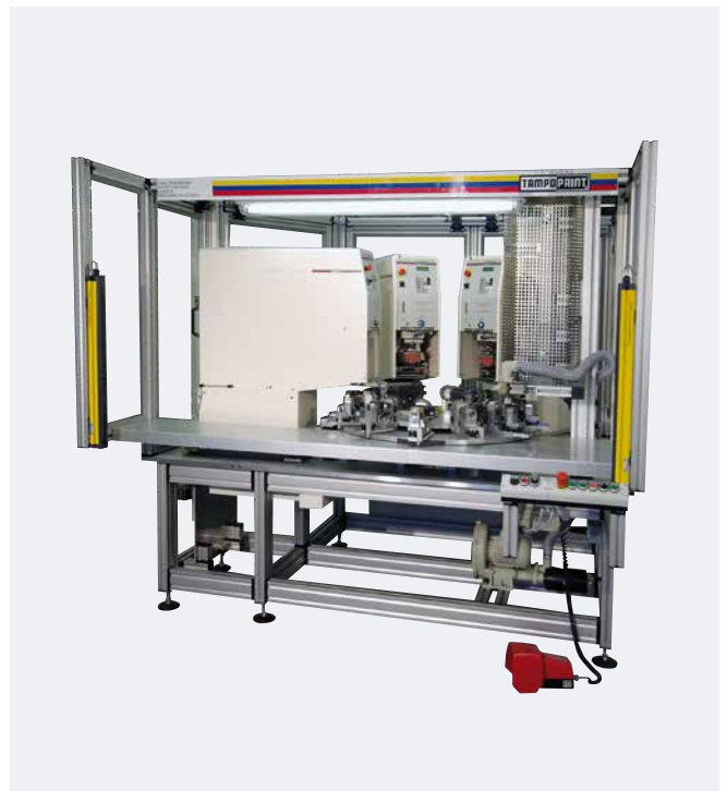
Modul Automation Gehäuse Mobiltelefon