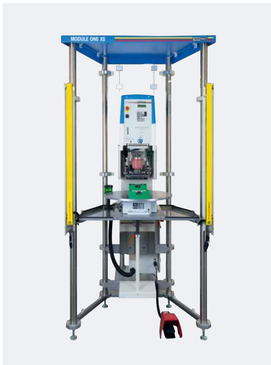
MODULE ONE XS Handarbeitsplatz mit Rundschaltteller und Lichtvorhang

Maschinenbau „Made in Germany“, gestützt durch hoch qualifizierte Mitarbeiter in Vertrieb, Projektleitung, Technik sowie Pre- und After-Sales-Service garantieren unseren Kunden die professionelle Umsetzung vom Konzept bis zur 24h Produktion.