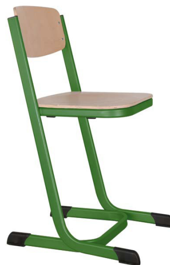
Schulstühle Doppel-U-Form, geschlossener Sitzträger