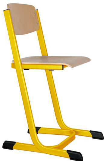
Schulstühle Doppel-U-Form, offener Sitzträger